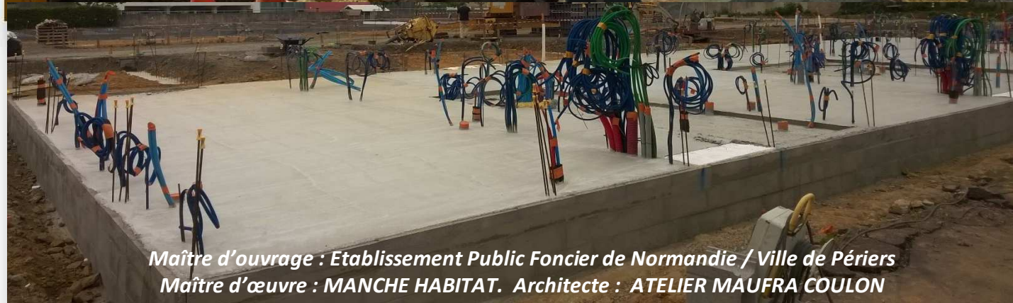
Maître d'ouvrage : Etablissement Public Foncier de Normandie / Ville de Périers Maître d'œuvre : MANCHE HABITAT. Architecte : ATELIER MAUFRA COULON