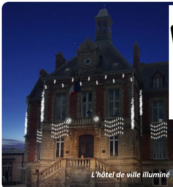
L'hôtel de ville illuminé

BULLETIN MUNICIPAL N° 16 - NOVEMBRE 2013