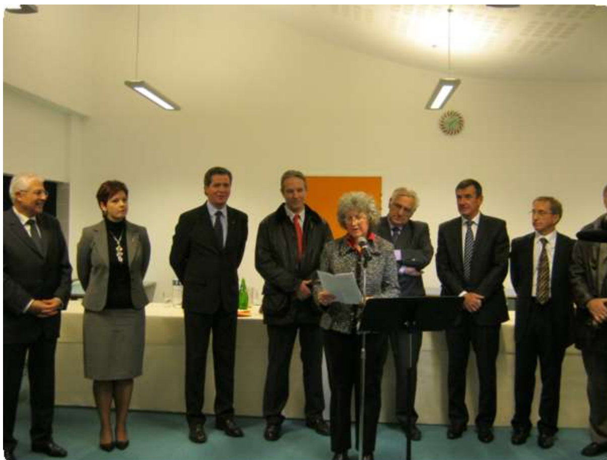
Inauguration du nouveau collège le 6 décembre 2010. Madame La Principale, puis de gauche à droite: Monsieur Le Député, Madame La Sous-Préfète, Monsieur Le Maire, Monsieur Le Conseiller Général, Monsieur Le Président du Conseil Général, Monsieur Le Préfet, L'inspecteur d'académie. page 3 sur 12